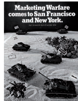
(Wojujący marketing przybywa do San Francisco i Nowego Jorku)

W wojnie militarnej wzgórze lub góry zazwyczaj uważa się za dobre pozycje strategiczne, szczególnie sprzyjające obronie. W wojnie marketingowej osoby na stanowiskach kierowniczych, mówiąc o silnych pozycjach, zazwyczaj posługują się pojęciem „wysokich pozycji”. Stąd też przywołanie pojęcia góry jako kluczowej koncepcji dla marketingowych działań wojennych wydaje się jak najbardziej uzasadnione.